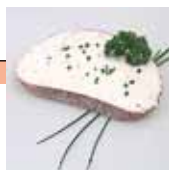
Fromage frais sur une tranche de pain