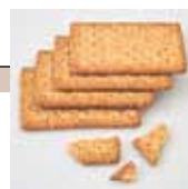
Crackers à la farine complète