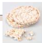
Galettes de riz